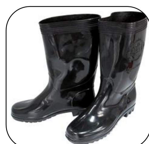
รองเท้าพื้น ยางหุ้มแข็ง

สวมใส่อุปกรณ์ป้องกันอันตรายทุกครั้ง เมื่อปฏิบัติงานจัดเก็บ ขนย้ายขยะและสารพิษ