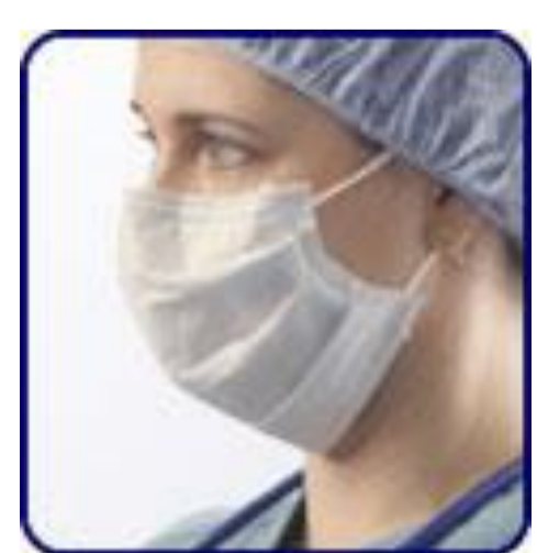
ผ้าปิดปาก จมูก (หน้ากากอนามัย)