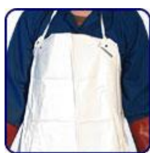
ผ้ากันเปื้อน